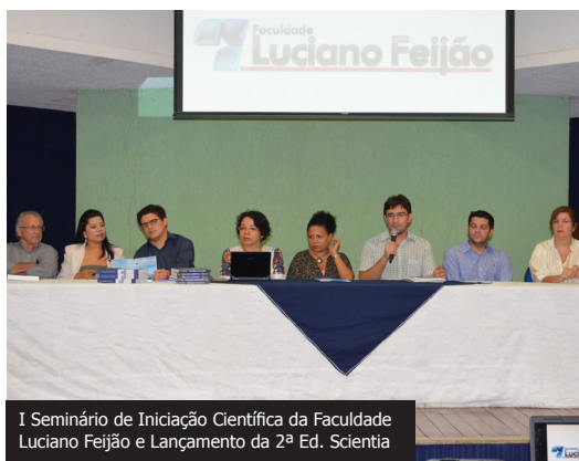
I Seminário de Iniciação Científica da Faculdade Luciano Feijão e Lançamento da 2ª Ed. Scientia

a questão dos direitos, quanto a questão da gestão ou, ainda, das subjetividades e da própria multiplicidade humana. Os artigos devem ter de 10 (dez) a 15(quinze) laudas e devem ser encaminhados para scientia@flucianofejao.com.br até o dia