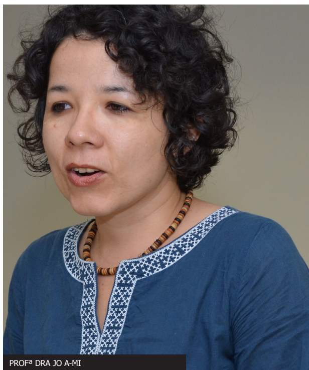
PROF a DRA JO A-MI

Por fim, tenho ótimas perspectivas de trabalho na Faculdade Luciano Feijão, especialmente por perceber, através dos colegas e departamentos instituídos, um verdadeiro empenho no projeto central proposto pela Diretoria e mantenedores dessa instituição de ensino: qual seja, o de transformar a faculdade em Centro Universitário - modelo de promoção ampla dos campos de Ensino, Pesquisa e Extensão.