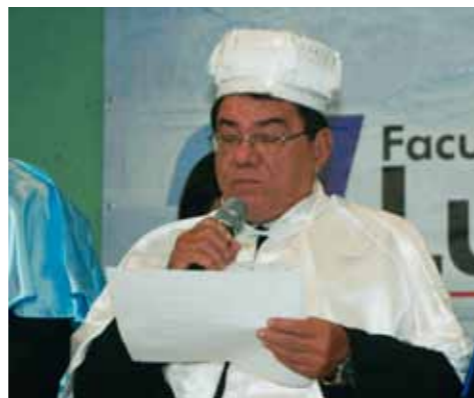
Chanceler faz a leitura de documento de outorga